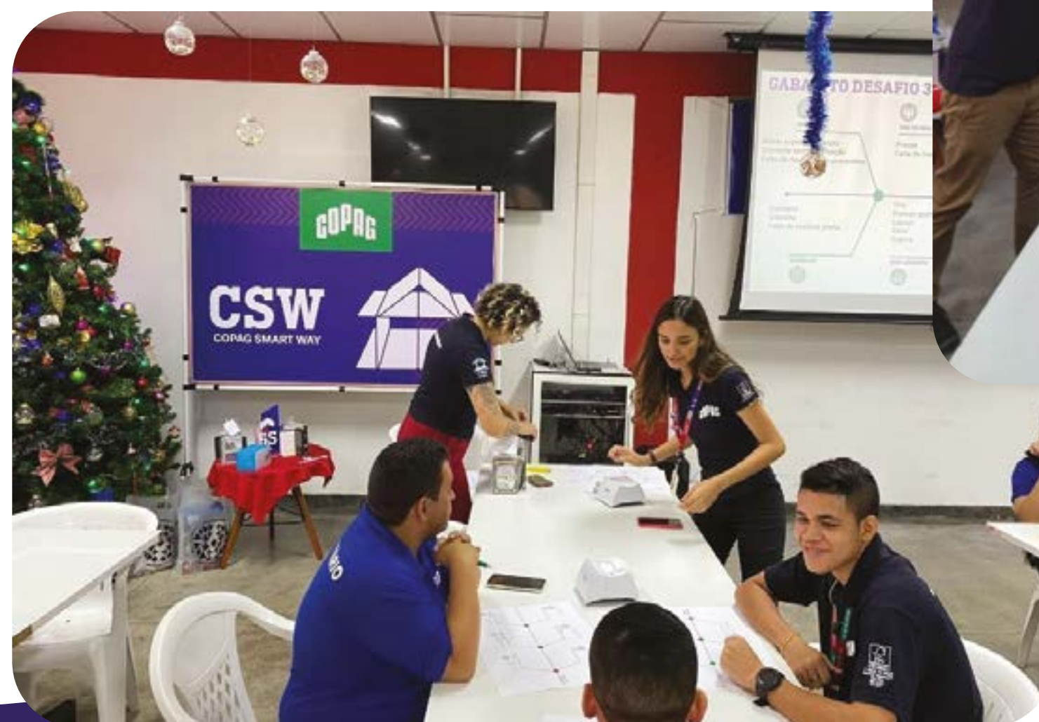
Colaboradores participam da dinâmica ISHIKAWA CSW na fábrica, em Manaus

A atividade, realizada na fábrica da Copag, em Manaus, demonstrou a utilização da ferramenta ISHIKAWA, que analisa perdas no processo, por meio da classificação dos problemas. Os colaboradores tiveram o treinamento em forma de competição para melhor assimilação do conteúdo.