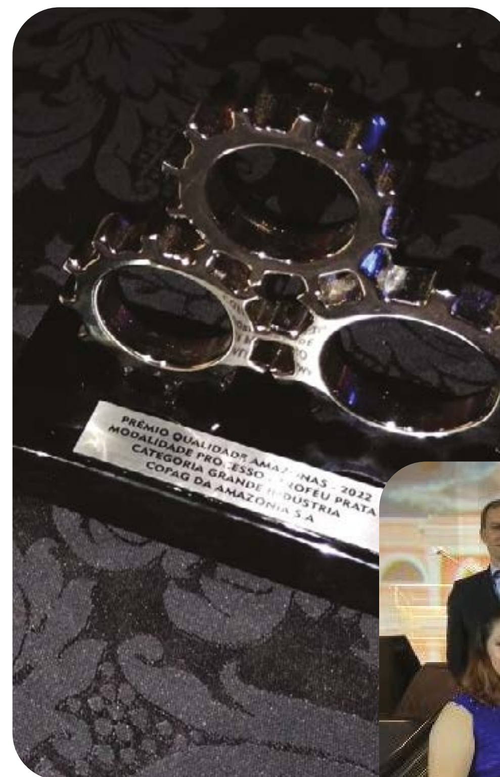
Prêmio Prata na modalidade Processo

O PQA acontece anualmente e, em 2022, realizou a 29ª edição do evento, que reconheceu e premiou esforços das companhias que buscam melhorar continuamente seus processos produtivos e sua gestão operacional.