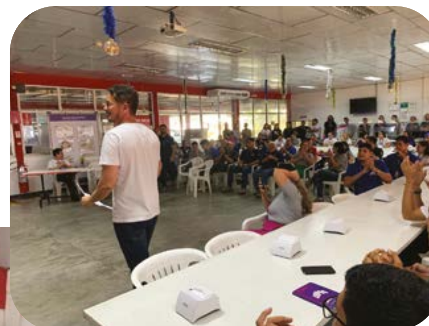
Fechamento da semana CSW